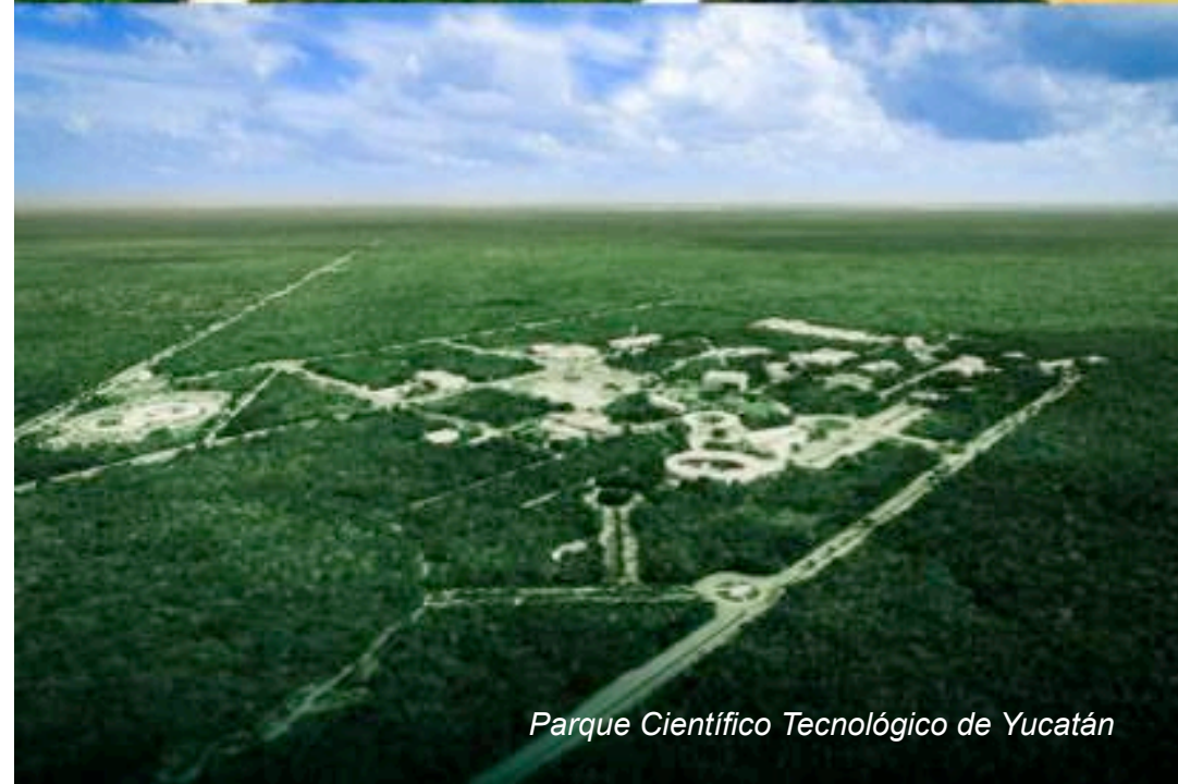
Parque Científico Tecnológico de Yucatán